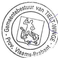
R. DE KEYZER