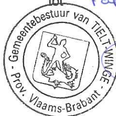
R. DE KEYZER