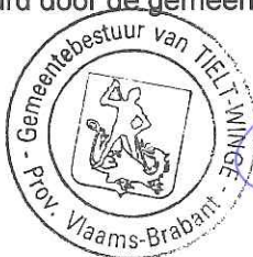
R. DE KEYZER